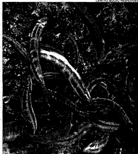
CENTRO BUCEO HESPERIDES

Los fondos marinos de la Región guardan tesoros de gran colorido como medusas (izquierda), tan denostadas hoy día, y peces de toda clase y condición (centro y derecha)